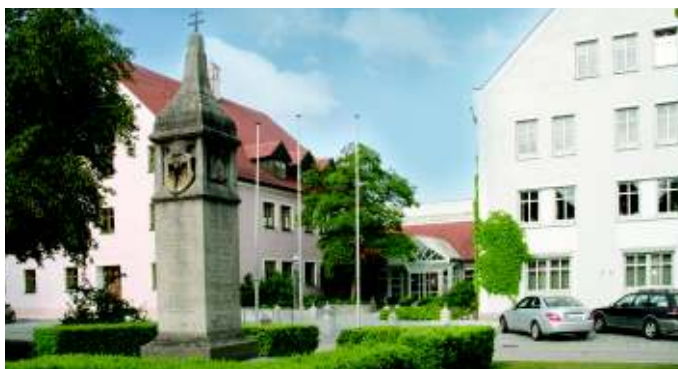
Landratsamt Dingolfing-Landau - Betreuungsstelle - Obere Stadt 1 • 84130 Dingolfing Tel. 08731/87-459