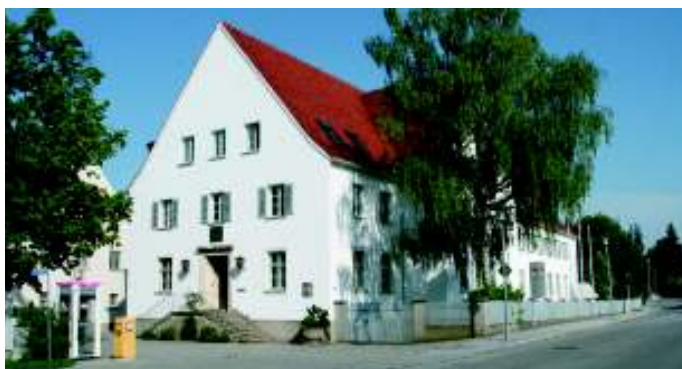
Amtsgericht Landau/Isar Vormundschaftsgericht Betreuungsstelle Hochstraße 17 • 94405 Landau/Isar Tel. 09951/945-0